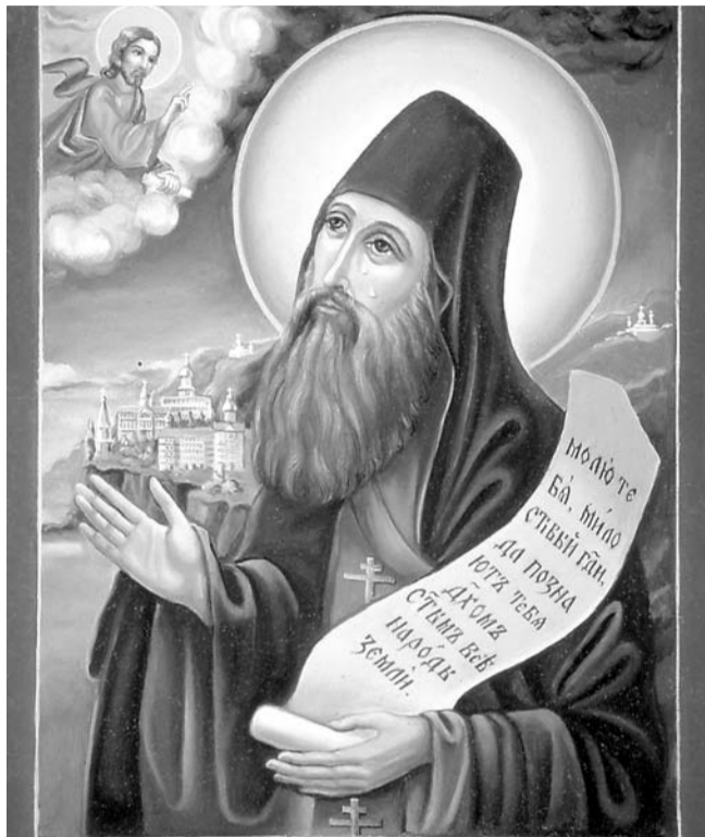
Преподобный Силуан Афонский со слезами молился о всех людях и о всём мире

Покойный, которого они проводили, скорее всего, не был совсем уж неверующим. Допускал, что есть какой-то высший разум, имел ложное понимание о Боге, ведь правильной вере его не научили ни родители, ни школа. Не научила даже Церковь, которой он гнушался, считал, что храм – это для больных, слабаков и прочих неудачников.