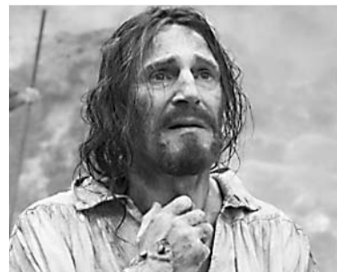
Кадр из фильма «Молчание»