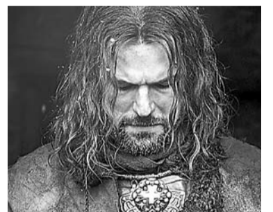
Кадр из фильма «Викинг»

Обо всём этом заставляет задуматься фильм «Молчание». Никто