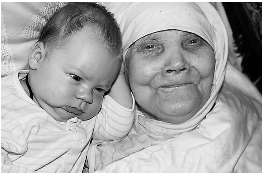
Матушка с одним из вымоленных младенцев

Именно в тот день, когда должны были вечером прийти сваты, и