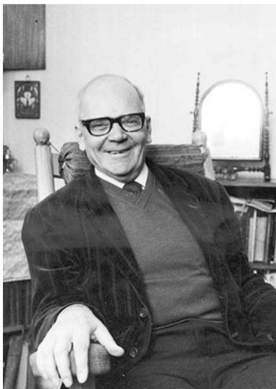
Тит Коллиандер родился в Санкт-Петербурге в семье полковника императорской армии