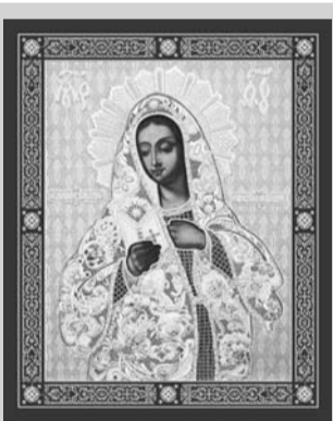
ТРОПАРЬ Пресвятой Богородице в честь иконы Ея «Калужская»

Проезд до храма святителя Тихона на авт. №№ 2, 3 до остановки «Кончаловские горы».