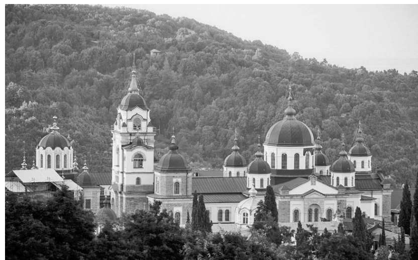
Величественный Андреевский Собор на Афоне

При подготовке статьи использовались материалы с православных сайтов