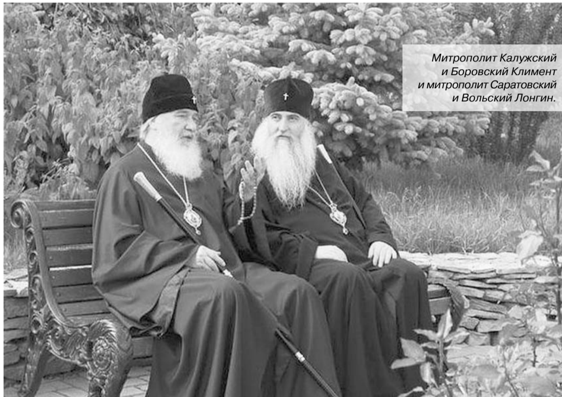
Митрополит Калужский и Боровский Климент и митрополит Саратовский и Вольский Лонгин.

книги, которые они читают и перечитывают по многу раз, — но и такое сравнение будет некорректным по отношению к Евангелию. К нему нужно не просто возвращаться время от времени — Евангелие должно жить в сердце христианина».