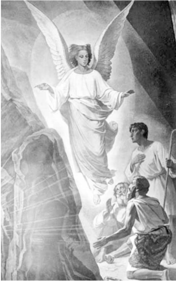
Окончание. Начало на стр. 1