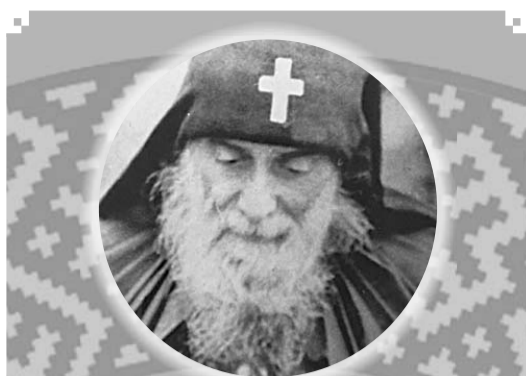
СВЯТОЙ ПРЕПОДОБНЫЙ ГАВРИИЛА (УРГЕБАДЗЕ; 1929–1995) —

великий старец нашего времени, архимандрит Гавриил смиренно скрывал многочисленные дары Святого Духа и любовью приводил людей к Богу. Часто ходил в рваной одежде, босиком, юродствовал, скрывая свою святость и намеренно унижая себя. Старец Гавриил, в миру Годердзи Васильевич Ургебадзе, уроженец Тбилиси, с детства полюбил пост и молитву в уединении. Пост строго держал даже в армии, делая вид, что у него болит живот от мяса. Во дворе родного дома своими руками построил многоглавую церковь, иконы для которой находил на городских свалках, куда в те годы свозили вместе с мусором многочисленные святыни. Он разделил участь многих верующих того времени: был гоним, оказался в психиатрической больнице. В истории болезни было записано: «Диагноз: психопатическая личность... Разговаривает сам с собой, что-то тихо шепчет. Верит в Бога, в Ангелов. Постоянно повторяет слова: "Всё от Бога"». Архимандрит Гавриил (Ургебадзе) был истинным подвижником, обладал удивительными духовными дарованиями: горячей верой, даром духовного рассуждения, даром угадывать тайны человеческих сердец, прозорливостью. По молитвам старца происходят многочисленные исцеления. Впервые в истории Грузии в 2014 году были обретены нетленные мощи святого. Сохранились многие изречения святого преподобного Гавриила (Ургебадзе).