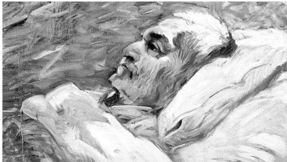
Портрет отца во время болезни. Художник: Франц Марк

Божии судьбы как бездна. «Кто познал ум Господень?» (1 Кор. 2: 16) — спрашивает святой апостол Павел.