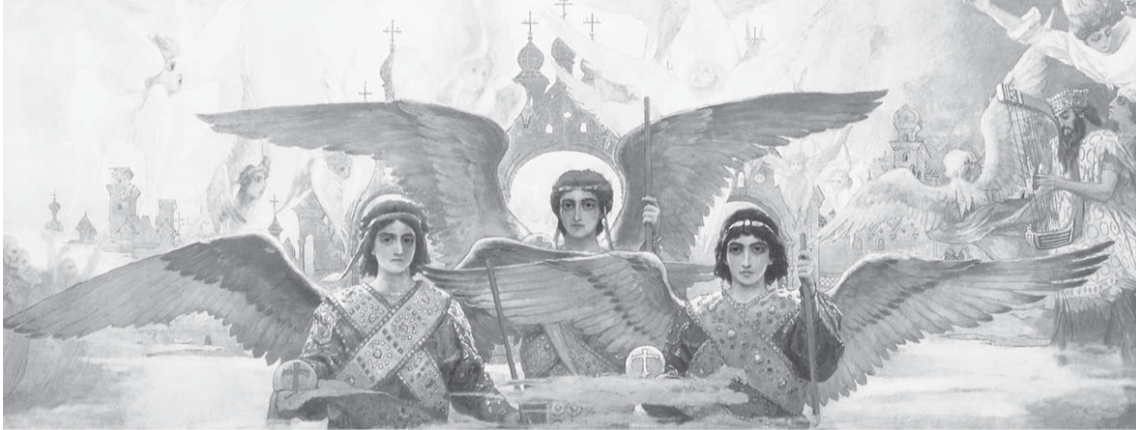
Виктор Васнецов «Преддверие рая»