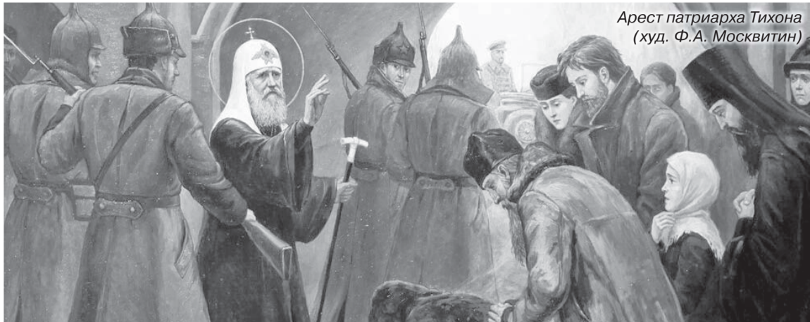
Арест патриарха Тихона (худ. Ф.А. Москвитин)

Трибунал приговорил 11 обвиняемых к расстрелу. После вынесения приговора Патриарх Тихон обратился с письмом к председателю ВЦИК Калининну «о помиловании осужденных, тем более что инкриминируемого послания они не составляли, сопротивление при изъятии не проявляли и