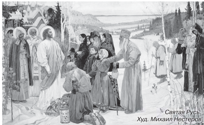
Святая Русь. Худ. Михаил Нестеров

Если это точный портрет Святой Руси, то это предсмертный портрет. Всего через три года грянет первая русская революция, показавшая, сколь мало на Руси тех, кому дороги Церковь и Царство. До 1917 года тоже рукой подать, а там, как известно, гражданская война, коллективизация и прочие виды платы за переустройство, вычистившие Русскую землю, словно виноградник при уборке ягод (см.: Мих. 7: 1). В конце концов крестьянство будет уничтожено. Земля потеряет хозяина. Исчезнет тот массовый тип многодетного и рабочего человека, который любит землю, знает ее запах и умеет на ней работать. И если крестьянство действительно навсего является авангардом христианства на Руси, смиренным, но многолюдным авангардом, то мы видим именно предсмертный портрет русского христианства. Ибо, повторяю, крестьянства скоро уже не будет. Но вот прошло уже более ста лет с тех пор, как Нестеров написал картину. Христианство есть. Все еще есть, подтверждающая свою сущностную связь с не могущим более умереть Господом Иисусом Христом. Да, оно потрепано историческими бурями, иногда едва живо, но оно есть. И вовсе не крестьянство, к горю ли, к счастью ли, является его главным носителем. Оно ушло из деревни в города, от лаптей к ботинкам и от зипунов к плащам и макинтошам, из изб в панельные дома с тесными квартирами. Даже намека на эту грядущую метаморфозу