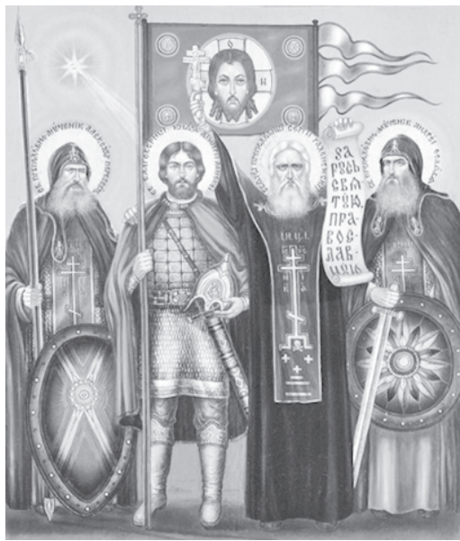
Свт. Димитрий Ростовский:

— Не думай, слушатель мой, чтобы я говорил слова эти о тех врагах, которые воюют с нашим христианским отечеством и враждуют против нашей благочестивой веры... Тех не только нельзя любить, но даже необходимо выступать войной против них, полагая душу свою за христианское царство и целость Церкви.