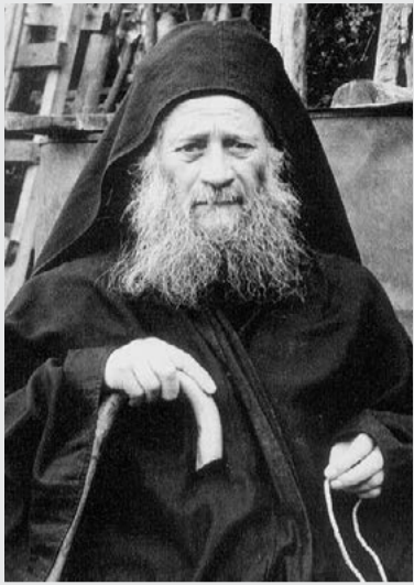
Иосиф Исихаст (в миру Франгискос Коттис) — выдающийся подвижник благочестия XX века, духовный наставник многих афонских монахов. Канонизирован как местночтимый Афонский святой.